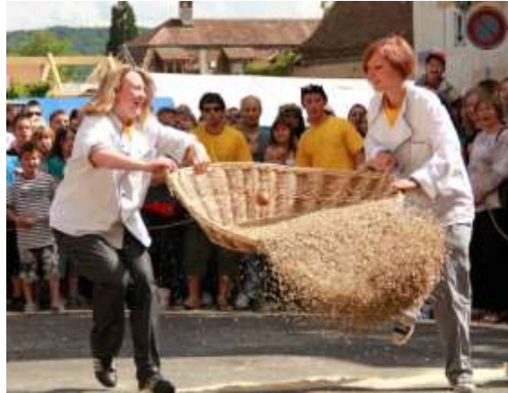
Traditionnelle course aux œufs du dimanche

Tout commence en... 1879 ! Oui, il y a plus de 135 ans... On célèbre cette année-là une dernière messe dans la vieille Chapelle du Rosaire (construite en 1608), qui doit être démolie. En 1879, une nouvelle église est consacrée. Depuis cette date, la Jeunesse du village commémore l'événement, chaque premier dimanche de mai, par l'organisation d'une course aux œufs!