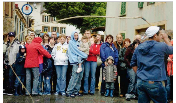
PRUDENCE Les claqueurs de fouet n'avaient pas besoin de tenir de grands discours pour que la foule se tienne à distance.