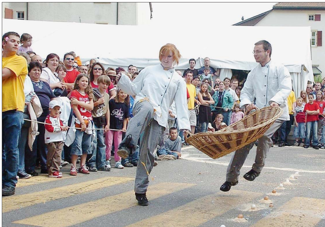
RECEVEURS Ce n'est pas faute d'avoir essayé, mais les préposés au van n'ont pu sauver que quatre œufs du massacre.