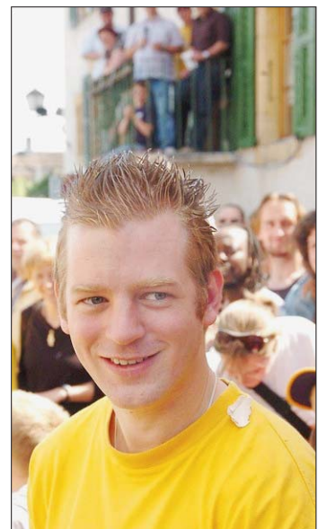
BAPTISÉ Jaune sur jaune, rien ne bouge...