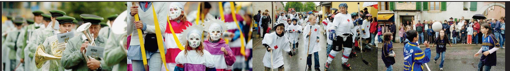
DÉFILÉ Les groupes ont défilé juste après la pluie diluvienne qui s'est abattue samedi après-midi.