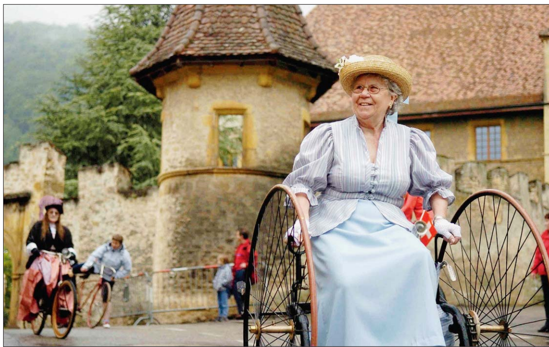
VIEILLES BÉCANES Venus de plusieurs cantons suisses, un groupe d'amateurs de vieux vélocipèdes a été fort applaudi samedi après-midi.